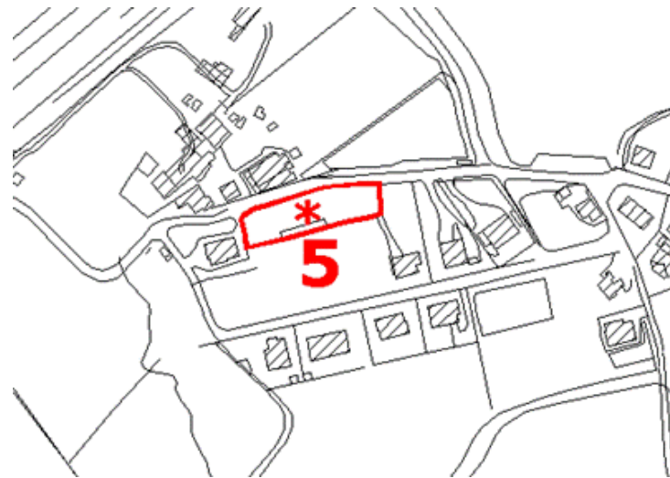
Fig 1.2 Area a manifestazione temporanea 5