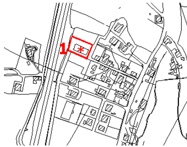
Fig. 1.1 Area a manifestazione temporanea 1